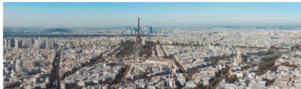
PARIS 11 janvier 2018